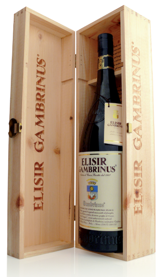
Magnum 1,5 cl. 150 Cassa legno da 1 bottiglia, peso Kg. 4 Cartone da 2 bottiglie, peso Kg. 7.6