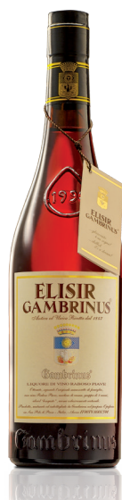
Classico cl. 70 / cl. 100 Cartone da 6 bottiglie Peso Kg. 9 / 10,5