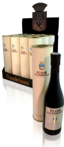
Tubo e Mignon, cl. 10 Espositore 12 Tubi Peso Kg. 4